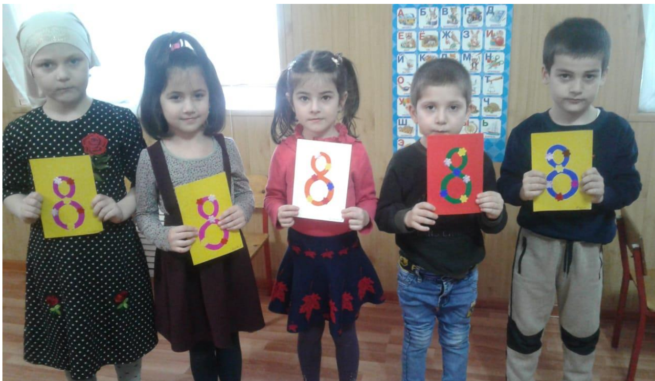
Наши открытки для мамочек .

Создание папки передвижки «8 Марта – Женский день», «Папа, мама, я здоровая семья».