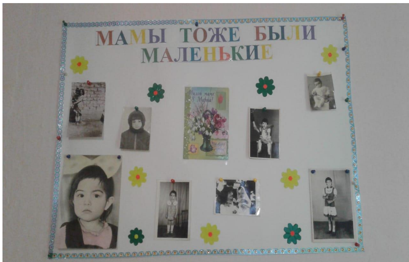
Наша фотовыставка: «Мамы тоже были маленькими»