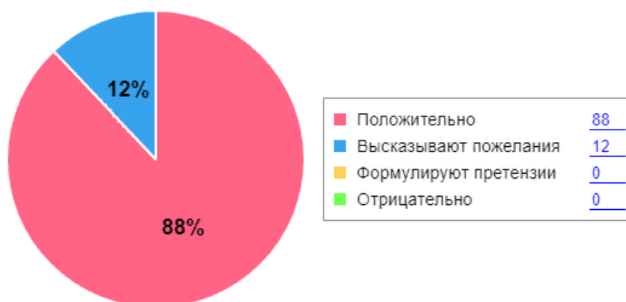
Как родители оценивают детский сад

Используются следующие формы работы с родителями: